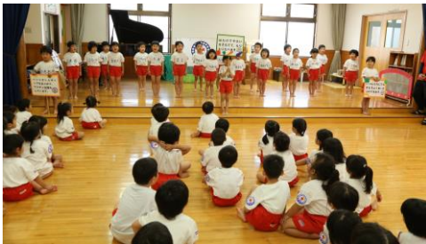
朝の集り・日赤開校式の様子