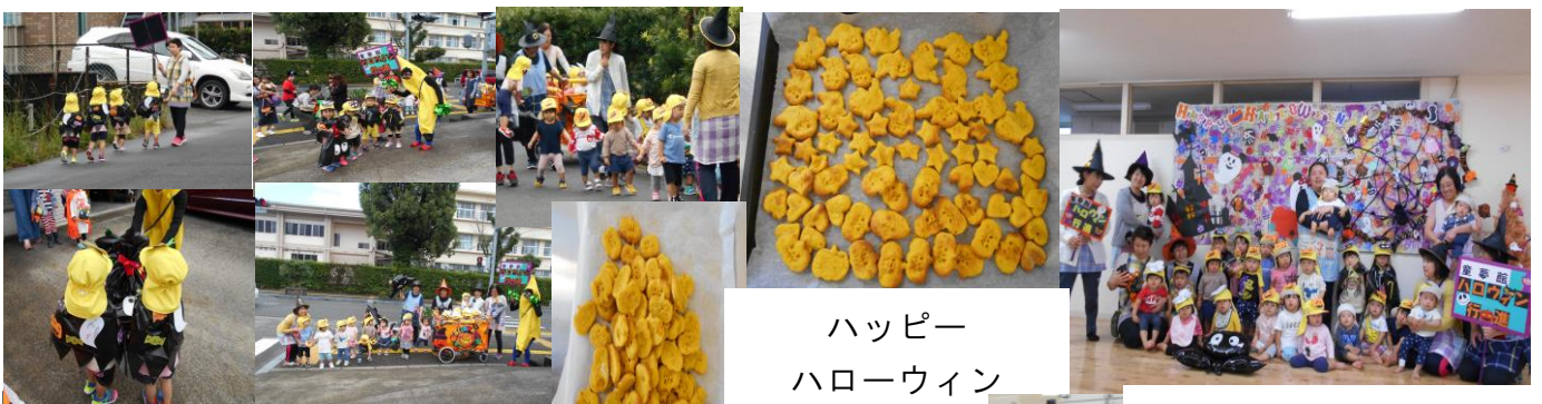
ハッピー ハローウィン